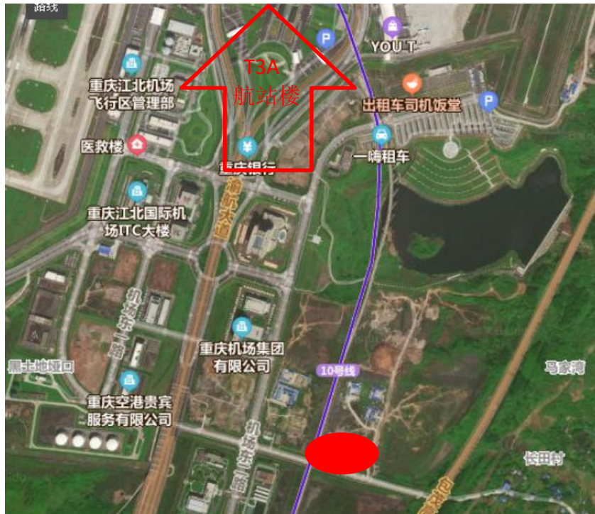
图 1.3 宿舍楼工程位置示意图