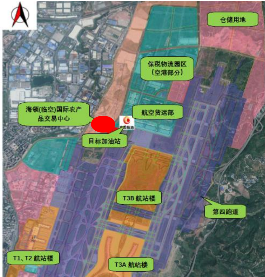
图 1.4 加油站项目位置图