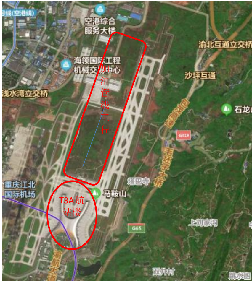
图 1.2 机坪加油管线工程范围示意图

主要建设内容包括机坪加油管线工程（范围示意图见图 1.1）和第二航空加油站宿舍楼两个部分（位置示意图见图 1.2）。本工程占地约 30 亩，不涉及拆迁。本工程计划工期为 2020 年动工，2023 年竣工。